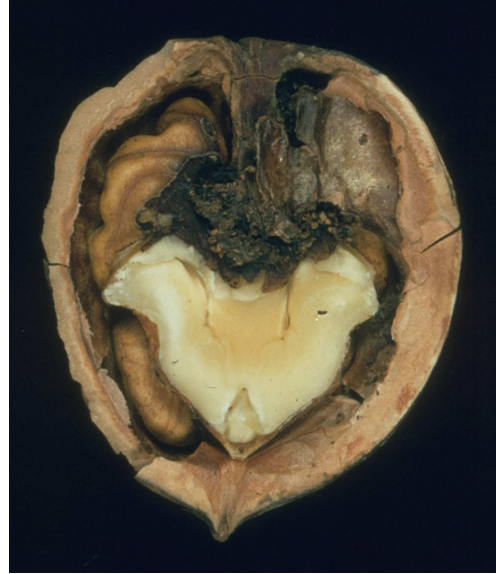
Abb.3: Xanthomonas-Befall des Fruchtkerns