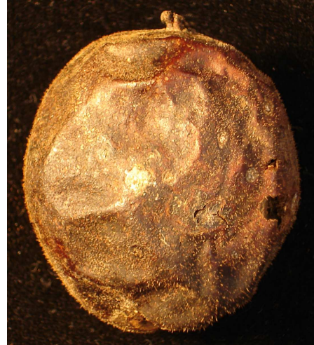
Abb.5: Marssonina-Fruchtbefall (spätes Stadium)

Während der Vegetationsperiode breitet sich der Pilz rasch über Konidien aus, die in sehr großer Anzahl in den Acervuli gebildet und über Wind und Regenspritzer verbreitet werden. Marssonina juglandis überwintert als Hauptfruchtform ( Gnomonia leptostyla ) in befallenem Falllaub. Dort werden auf sexuellem Weg im Spätherbst und Frühjahr kleine schwarze Fruchtkörper gebildet, die sogenannten Perithezien. Aus ihnen werden im Frühjahr ähnlich wie beim Apfelschorf Ascosporen ausgeschleudert, die bei ausreichender Blattnässedauer die jungen, sich entwickelnden Blätter infizieren. Etwa 14 Tage nach der Infektion entwickeln sich dann erste kleine Blattnekrosen, in denen dann in Acervuli Konidien für die weitere Verbreitung gebildet werden.