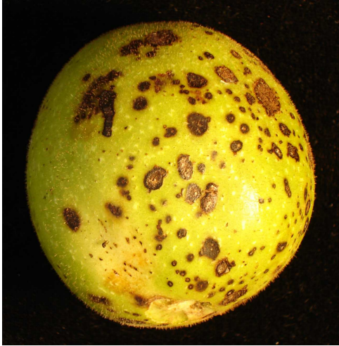
Abb.4: Marssonina-Fruchtbefall (frühes Stadium)