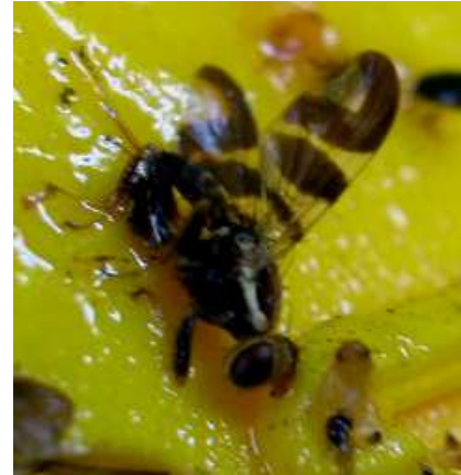
Abb.7: Walnussfruchtfliege auf Gelbtafel

Die ursprünglich aus Nord-Amerika stammende Walnussfruchtfliege ( Rhagoletis completa ), die mit der Kirschfruchtfliege verwandt ist, tritt bislang nur sehr lokal in Baden-Württemberg auf. Ende Juni bis Anfang September schlüpft sie aus der Puppe. Das erwachsene Tier hat etwa die Größe einer Stubenfliege (Abb. 7), ist aber im Gegensatz zu ihr sehr farbig und trägt wie die Kirschfruchtfliege ein gelbes Rückenschild. Die Weibchen legen ihre Eier in Gruppen in die grüne Fruchtschale. Die daraus nach etwa fünf Tagen schlüpfenden weißlich-gelben Larven ernähren sich vom Fruchtfleisch, das dadurch schwarz und weich bis schleimig wird. Die Fruchtfleischreste bleiben fest an der verholzten